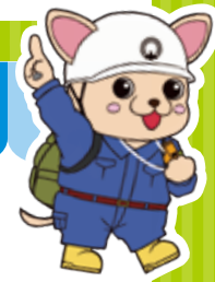
三鷹市防災キャラクター じじよまる