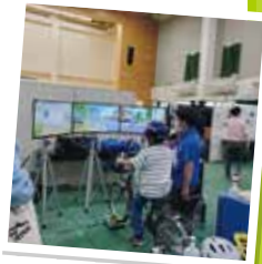
自転車シミュレーター