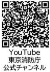
YouTube 東京消防庁 公式チャンネル

防災訓練等へ参加しづらい方も、防災行動力の向上及び自主防火の推進のため、本動画等を自宅や事業所で活用していただき、消火器の使い方を覚えましょう。