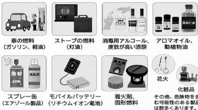
身の回りの危険物例