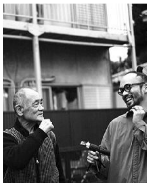
聞き手・亀井寛之 執筆・写真・熊井晃史 参考文献リサーチ・宇山陽子 ロケーション・ジョイフル観光

..ジョイフル過ぎます!し、井 野さんの曾祖父の方は、水車を動 力にして組紐を作る工業を起し ていたそうですが、技術者の血と いうものを感じてしまいます。 ..幸吉さんは、子どもの時には まだご存命で、膝に乗せてもらっ たりしていました。工場はあそこ にあつて:(と、「三鷹市史(197 0年発行)」も参照しながらまとめ ると、明治に始まるこの組紐工業