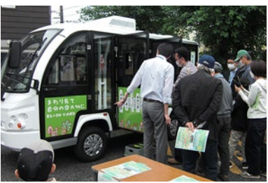
可愛いらしいと乗車体験に行列

3年間の思いと行動、一人ひとりが持っている力が積み重なって、コロナ禍の中でも、皆様に楽しんでいただけたおまつりが出来たことと思います。そして、会場設営や当日の運営・片づけにご協力いただいた、成蹊大学の皆さん、実行委員さん、事務局職員さん、おまつりに関わってくださったすべての方々にお礼申し上げます。ありがとうございました。