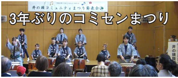
3年ぶりのコミセンまつり

例年であれば模擬店でにぎわう本館駐輪場ですが、今年は少し寂しく感じました。来場される方が楽しみにしている花鉢プレゼント