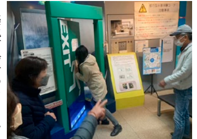
水の圧力で開かない

コロナ禍の影響で11月29日に3年ぶりの開催となった研修ツアー。12名の参加があり、墨田区の本所防災館と港区愛宕のNHK放送博物館を見学した。