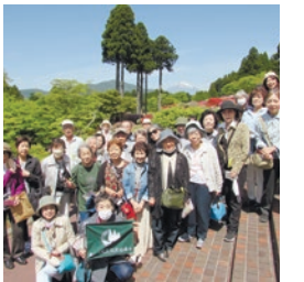
日本の文化をたずねて