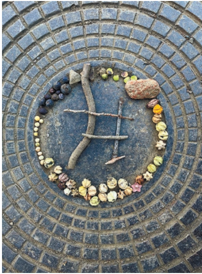
自然がいっぱい井の頭 投稿者: パン大好き

川沿いの桜並木です。季節によって見える景色が変わって、どれだけ急いでいても綺麗なあと少しほっとする場所です。