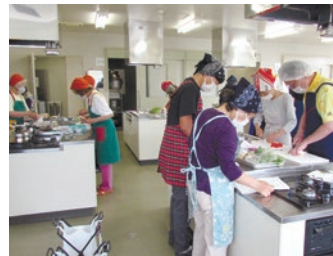
健康栄養料理教室