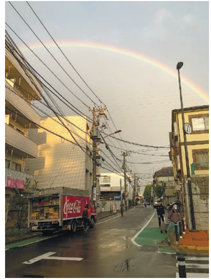
虹の写真 投稿者: コバ