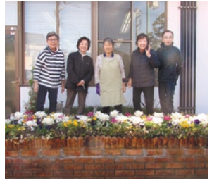
花壇維持管理事業