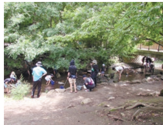
神田川の生きものしらべ