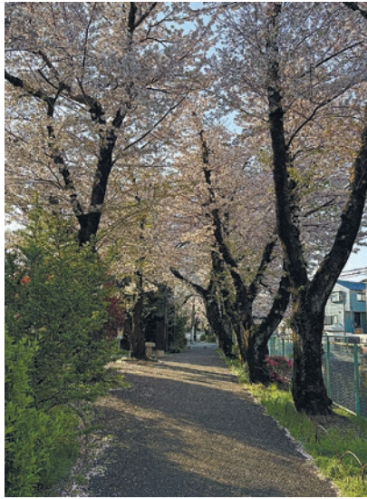
季節が移ろう道 投稿者: わか

川沿いの桜並木です。季節によって見える景色が変わって、どれだけ急いでいても綺麗なあと少しほっとする場所です。