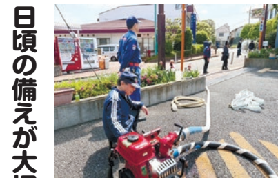
可搬式ポンプ操作・放水訓練

4月14日に文化部会が始動し、6月25日の「絵画講習会」、8月30日の井の頭合奏団による「サロンコンサート」と、行事日程が決まりました。 「絵画講習会」は、まったく絵の経験がない方でも気軽に参加できるように、画用紙は用意します。4B・5Bの鉛筆と消しゴムを持参いただければ、石膏デッサンができます。絵の具や筆の用意ができる方は、花やりんごを描いてみてください。絵は何歳からでも楽しんでください。